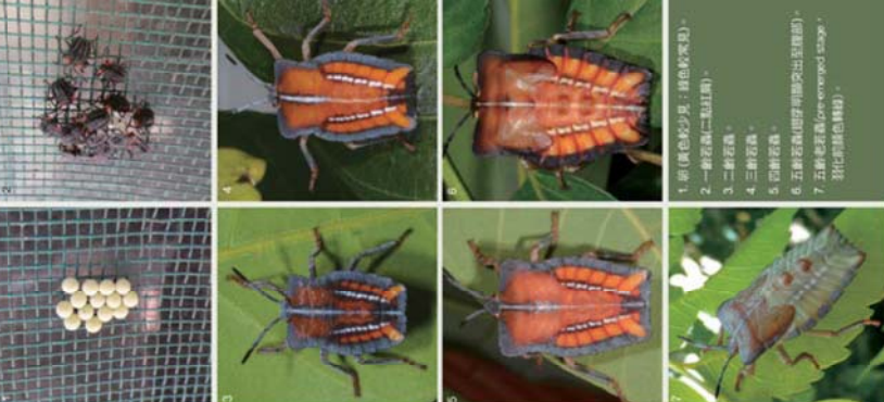
1. 卵(黃色較少見，紅色較常見)。 2. 一齡若蟲(二點紅點)。 3. 二齡若蟲。 4. 三齡若蟲。 5. 四齡若蟲。 6. 五齡若蟲(卵殼可顯出成蟲形狀)。 7. 五齡若蟲(成蟲)。