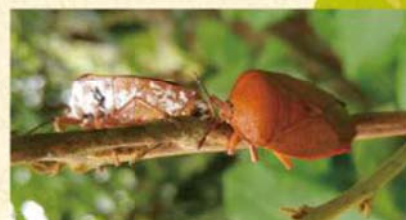
成蟲體呈盾形黃褐色，胸部腹面披白色蠟粉而成為荔枝椿象明顯特徵。