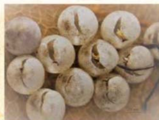
正常孵化的卵孔-長裂縫狀