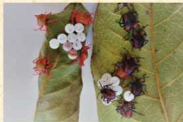
初孵化之一齡若蟲，體長0.5公分呈紅色長橢圓形，後則轉黑。