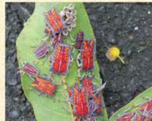
二至五齡若蟲體色橙紅具黑外框，狀如長方形撲克牌。