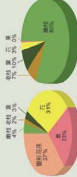
荔枝椿象在無患子各部位分布 荔枝椿象在臺灣各地各部位分布 比較荔枝椿象在平地無患子及農業區樹干各部位出現百分比 (07年~12月)

107年的調查結果顯示，農業區荔枝園、龍眼園在二月底回暖後就能看到荔枝椿象聚集結果樹嫩芽、花穗等，然而平地非農業區無患子植株則大多須等到四五月後才會在其嫩枝及剛抽出的花穗上發現荔枝椿象的蹤跡，這就如如同阿羅漢肉串一般。五月則大量出現在其黃花旁，六月則移到初結的幼果附近，七月結熟果時荔枝椿象重量就大幅下降，此後新羽化成蟲逐漸離開無患子，從九月到隔年三月整整7個月，每株無患子上的荔枝椿象平均數量隨季節接近零。