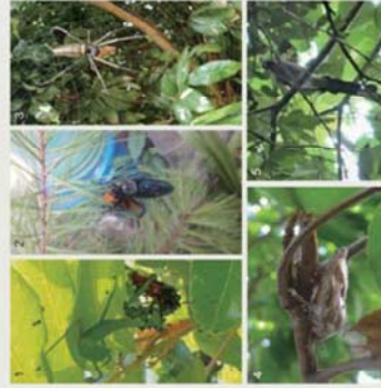
1 樹蟬；2 大斑捕食蠅虻捕食荔枝椿象；3 人面樹蟬 ( Megaphysa pulchra )；4 麗澤伴蜂蟻的荔枝椿象；5 樹小蜂寄生荔枝椿象。