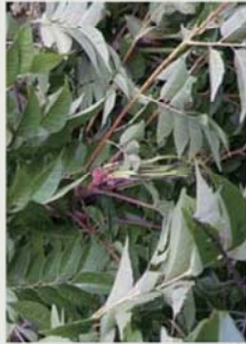
卵塊為幼蟲一出生即產下，有殼之蟲卵會隨時間變硬而難於剝離。

5-6月適度修剪枝條(修剪量勿超過1/3)，特別是葉柄枝或萌蘗枝，但須注意勿過度修剪影響樹木生長及開花，且殘枝葉量勿棄置原處，以免蟲量又移回。