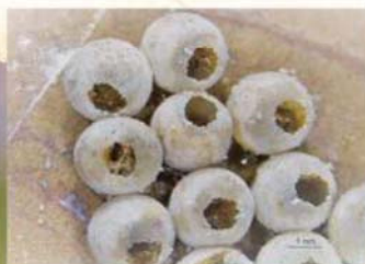
平腹小蜂羽化的卵孔-圓單孔狀

藥劑防治建議於清晨或傍晚進行，成蟲活動力較低。可依當年的氣候溫度(約1至2月下旬)，越冬的成蟲開始活動聚集於嫩梢時，進行第一次的施藥防治，於3月中旬後因成蟲活動力強，藥劑防治效果不佳，且已進入 開花期 ， 此時不建議用藥 ，以避免誤傷蜜蜂等授粉昆蟲，待至花期結束開始結小果後之荔枝細蛾防治階段，同時防治於葉背的荔枝椿象若蟲；用藥時請上網查詢防檢局公告核准藥劑。