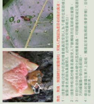
顏色、觸感、氣味、噴出的液體等，常使人們以為荔枝椿象的噴霧。 1: 目前仍存於空氣中的荔枝椿象噴霧仍對人眼有刺激作用(但無實質傷害，其刺激作用隨時間而減弱，此時增加任何液體噴出)。 2: 荔枝椿象噴霧對人眼有刺激作用(但無實質傷害，其刺激作用隨時間而減弱，此時增加任何液體噴出)。 3: 荔枝椿象噴霧對人眼有刺激作用(但無實質傷害，其刺激作用隨時間而減弱，此時增加任何液體噴出)。 4: 噴出的液體在葉片上凝結，繼續吸引螞蟥(使葉片變黃)，此為引誘螞蟥。