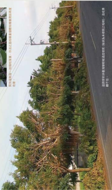
道路旁有許多臺灣樹供換過路車員(車牌為本博覽之標記)，這成蟻群不佳。

調查研究結果顯示臺灣樹上的荔枝椿象，絕大多數在4月至6月間出現在其嫩枝條上吸食或交配，修剪及防治重點應在樹冠層外層及殘留枝或萌蘗，花期一般在9月，荔枝椿象族群數量已大幅下降並開始繁殖，此時防治就太晚了。