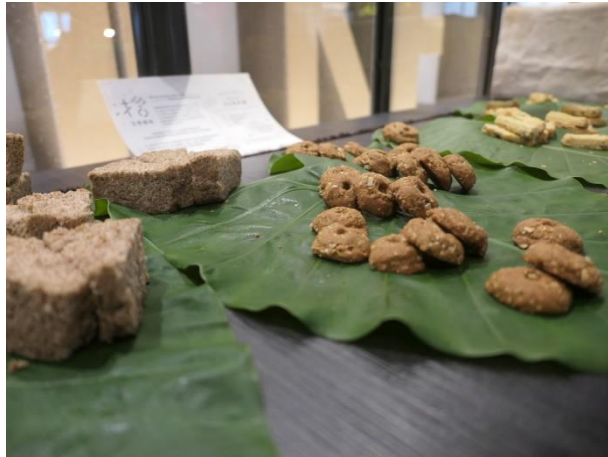
圖、來自大自然的盛裝器皿-葉子