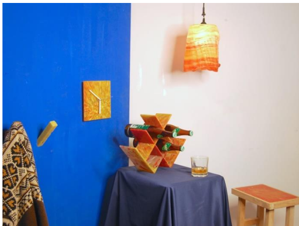
圖、再生家具讓廢棄的塑膠食器、瓶蓋、扭蛋殼活出新價值