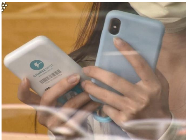
圖、以租代買，讓循環共享創造更大的價值