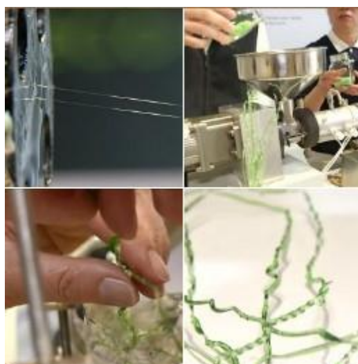
圖、寶特瓶抽紗成為再生衣物的原料