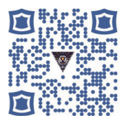
掃描進入推廣教育網 查看詳細課程資訊